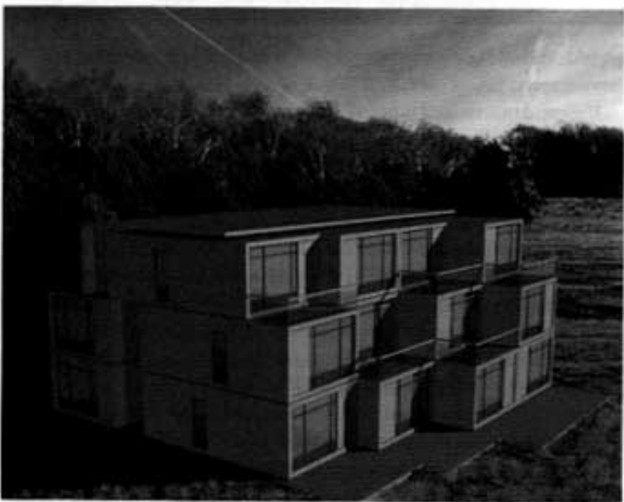
Fyra olika modeller av Gyllene Tider-hus. Den arkitektoniska idén bygger på en grundmodul på 32 kvm som kan staplas på höjden och läggas ut på bredden. För den som vill ha en större lägenhet kan två eller tre moduler slås ihop.

är loka- vårskönt tekt när- vid, park natur.»