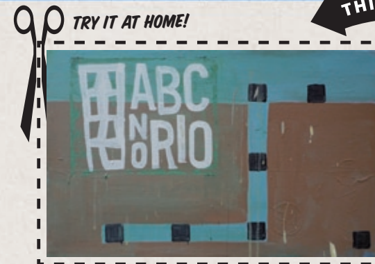
ABC NO RIO (NEW YORK), 2008