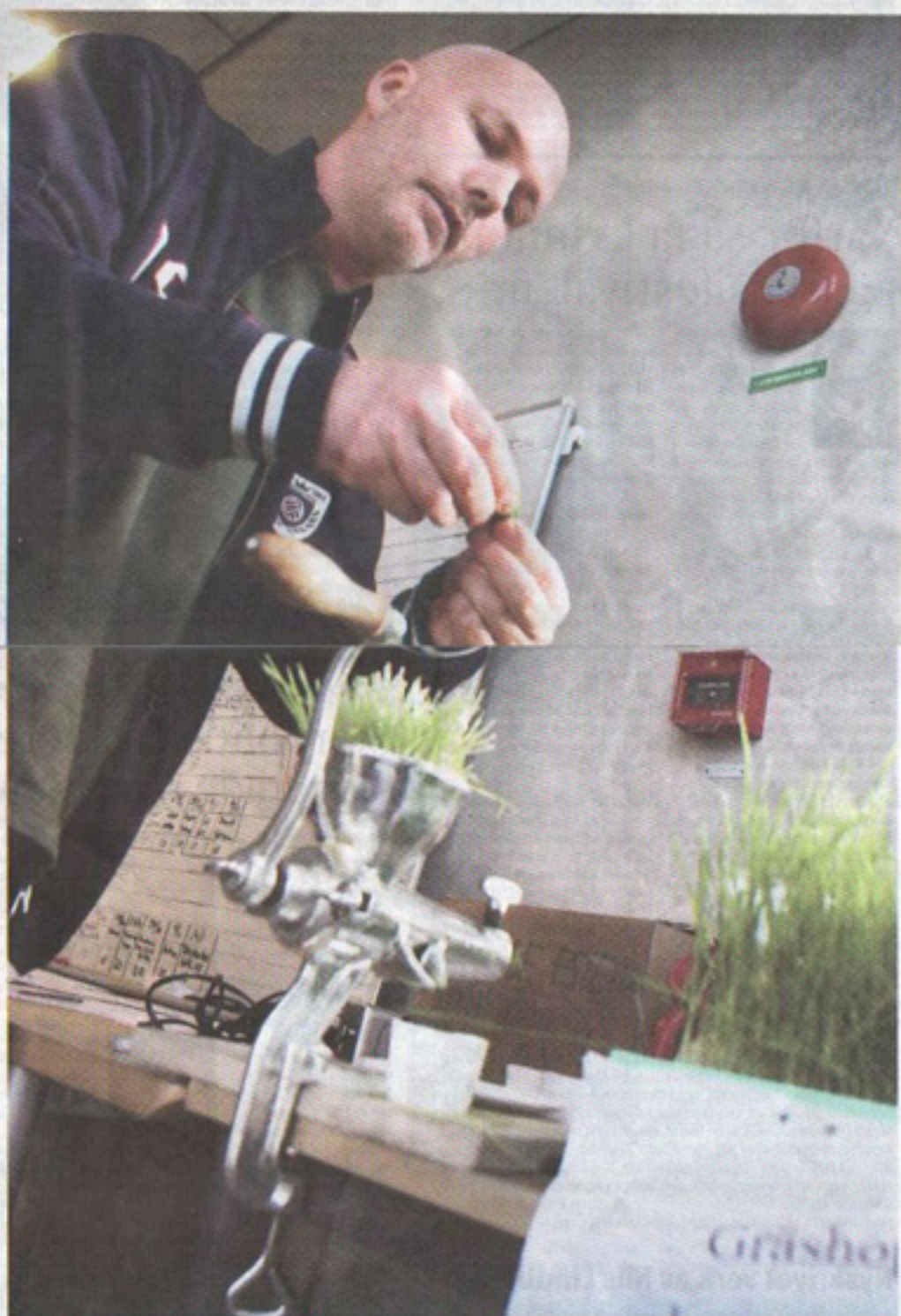
Vetegräsodlingen på Ericsson ger deltagarna i konstprojektet extra näring som saft.